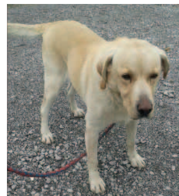
FALCO Labrador, pes, 4 roky, zlatý.