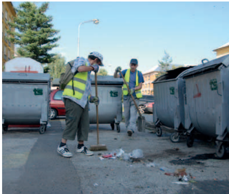
Dobrovolná veřejná služba funguje přímo pod městem. Likviduje nejen černé skládky, ale čistí parky, zahrádkářské osady nebo frekventované ulice. Stejně jako lidé z VPP uklízí také kontejnerová stanoviště.

Významnými pomocníky jsou lidé z veřejné služby a veřejné sprostředčování, tedy dlouhodobě nezaměstnaní. Čistí chodníky, zastávky nebo kontejnerová stanoviště a denně se vracují na stejná místa tak, aby tam bylo čisto trvale.