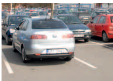
Majetková trestná činnost – krádeže a vloupání do vozidel – zaměstnává policii velmi často.

ní s rokem 2014, k poklesu trestné činnosti o více než 15 procent. Zároveň došlo k navýšení míry objasňenosti trestných skutků o více než 4 procenta. Mezi nejčastěji se vyskytující druhy kriminality patřila a stále patří majetková trestná činnost. V této oblasti převažují především kapsní krádeže, krádeže věcí z automobilů, hlavně u obchodních center a hypermarketů, a vykrádání sklepních prostorů. Potěšujícím zjištěním je, že u násilné trestné činnosti byl loni zaznamenán výrazný pokles – o více než 25 procent.