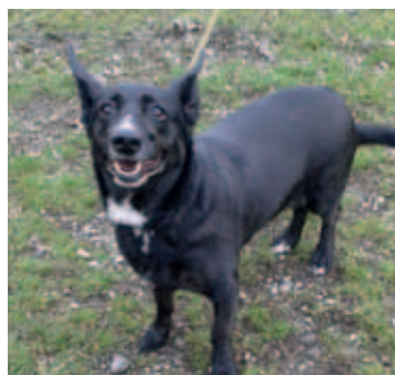
AXA, fenka, 3 roky, černá s bílým znakem pod krkem.