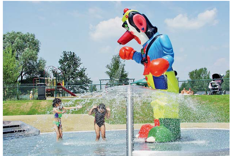
KARVINSKÝ AQUAPARK otevře v červnu, sledujte www.stars-karvina.cz . Vstupné nezměněno.

V současné chvíli také vrcholí přípravy na otevření sezóny na letním koupališti. „Čistíme, seřizujeme, montujeme, sekáme trávu