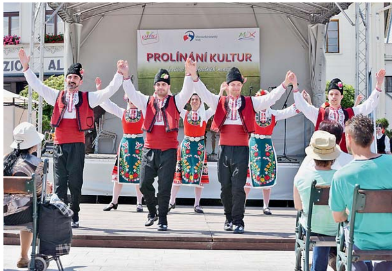
PROLÍNÁNÍ KULTUR je vždy atraktivní letní podívanou.