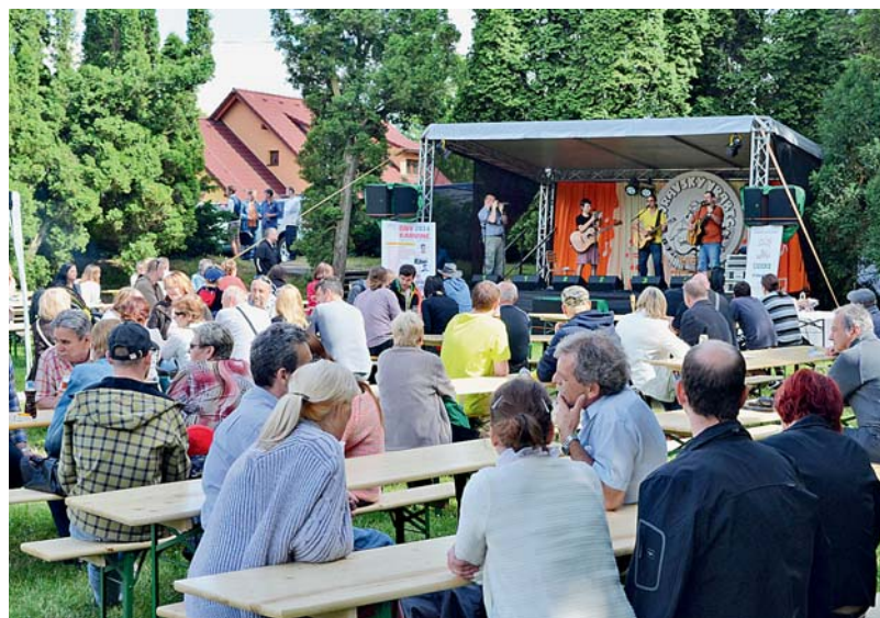
SOUČÁSTÍ DNŮ KARVINÉ je také soutěž Moravský vrabec.