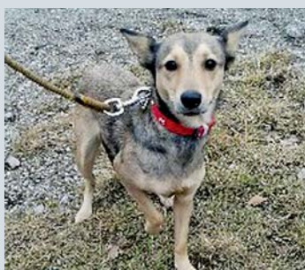
SINDY , kříženec, 2 roky