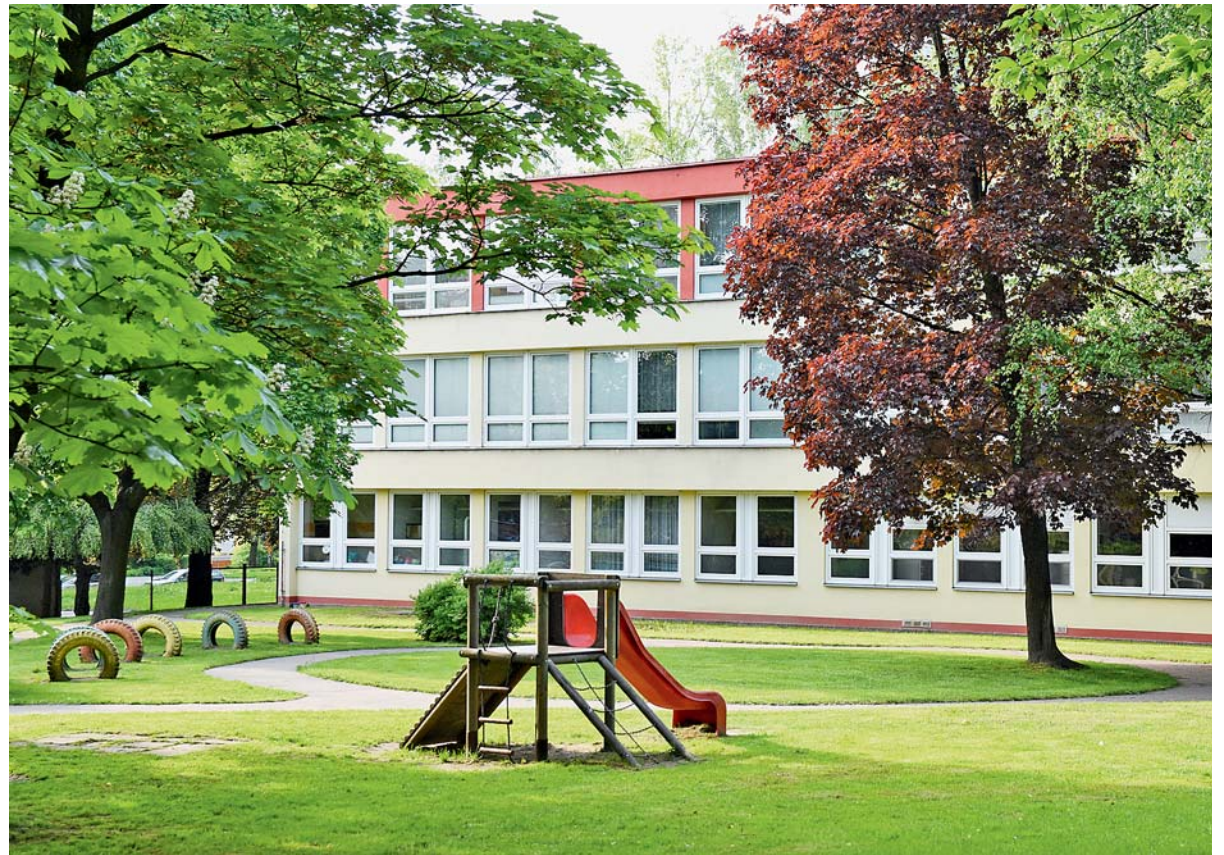
STAVEBNÍ ÚPRAVY a výměna hracích prvků proběhnou například v zahradě MŠ Hranice spadající pod ZŠ Slovenská.

Kromě prázdninových investic do budov a úprav škol myslí město také na modernizaci výuky, většinou podpořenou dotacemi Evropské unie. „Podnětné prostředí pro děti a kvalitně vybavené učebny, kde si budou moci to, co se učí, i prakticky vyzkoušet, je pro nás velmi důležité. Zkušenosti potvrzují, že takto si děti učivo lépe zapamatují a také je takové prostředí více motivuje,“ vylíčil Wiewiórka.