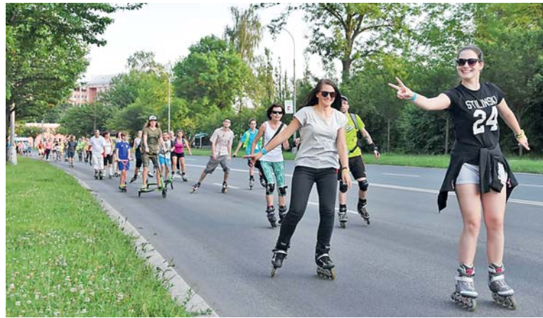
ZAČÁTEK PODZIMU V KARVINÉ ve znamení oslavy přírody a pohybu.

Zářijový program Evropského týdne mobility nebude ochuzen ani o tradiční vyjížďku na in-line bruslích. Město Karviná ve spolupráci s Mládežnickou radou Karviná zorganizovalo již tradiční projížďku Na In-line po Karviné. Akce se uskuteční v úterý 19. září 2017 s výjezdem z Univerzitního náměstí v 19 hodin. V případě nepříznivého počasí se akce přesouvá na čtvrtek 21. září 2017. Informace k online registraci na obě akce naleznete na webu města. Registrovat se je ale možné také na místě.