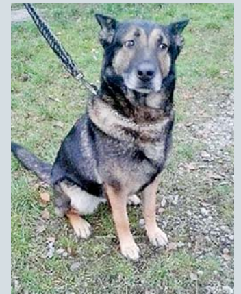
TARA , německý ovčák, 5 let

Psí útulek, ul. Brožíkova, Karviná-Darkov, tel. 727 869 211