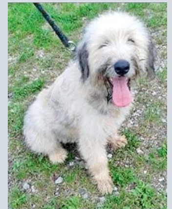
NERO , kříženec, 1 rok