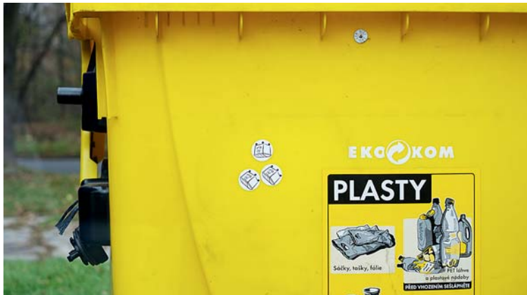
VLONI ZAUJALA HRA HLEDÁNÍ KONTÍKŮ – nálepky mizely z kontejnerů rychlostí blesku a vy jste za karty s nimi vyhrávali hezké ceny.

Hra Tref si svůj kontejner proběhne od čtvrtku 16. listopadu do neděle 19. listopadu. Zapojit se může každý, kdo přijde ve stanoveném čase třídít odpady na jedno ze 40 stanovišť s barevnými kontejnery v Karviné. Cílem bude trefit se do kontejneru nikoli míčkem, ale kusem toho správného odpadu. Dle vzdálenosti lze získat jeden nebo dva body. Jeden soutěžící občan má 3 soutěžní hody, ve kterých může získat až 6 bodů. Podle celkové dosažené bodů získá každý soutěžící jednu ze 3 recyklovaných odměn. Rozpis je už na webu a bude aktuálně také na Facebooku města. O tom, kam právě soutěžní hlídka míří, se lidé dozví také aktuálně z vysílání rádií Čas a Orion.