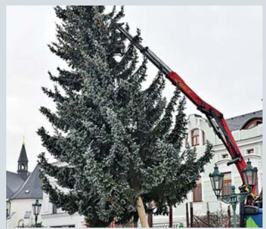
PŘIPOMĚŇTE SI loňskou instalaci na náměstí...

Kulturní dům plánuje slavnostní rozsvěcení stromu na náměstí se začátkem jarmarku v neděli 3. prosince odpoledne, o týden později připraví město na zámku Fryštát opět oblíbený program zaměřený na Vánoce šlechty a měšťanstva. Vánoční farmářské trhy na tržišti ve Fryštátě budou ve středu 13. prosince.