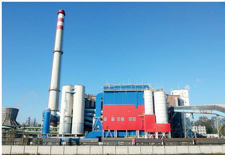
VEOLIA – TEPLÁRNA KARVINÁ – investuje pravidelně do ekologických vylepšení. V popředí odsířovací technologie spalin všech čtyř kotlů.