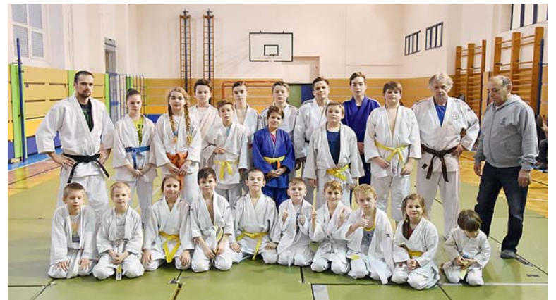
MSK JUDO KARVINÁ využívá tělocvičnu ZŠ a MŠ Prameny