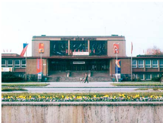
RETRO DEN 12. 5. se uskuteční v okolí MěDK v Novém Městě (foto 70. léta)

Máte doma černobílé fotky s vašimi vzpomínkami na Karvinou? Pošlete jednu nebo více naskenovaných nebo na mobil vyfocených fotografií na e-mailovou adresu soutez@mamiart.cz nebo v papírové podobě poštou na adresu MamiArt s.r.o., Politických obětí 118, 738 01 Frýdek-Místek. Pro 3 vylosované soutěžící věnoval partner Retro dní RESIDOMO skvělou cenu! Retro rodinné fotografování v ateliéru nebo exteriéru v hodnotě 2500 korun! Všechny použitelné fotografie budou zvětšeny a budou vytvářet stylovou kulisu na Retro dnech. Do předmětu e-mailu nebo na poštovní obálku uveďte „Retro hra“. Papírové fotografie prosím označte na jejich zadní straně podpisem a textem „Souhlasím s vystavením této fotografie na Retro dnech Karviné 2018“. Pokud budete fotky posílat e-mailem, uveďte tento text s podpisem přímo do e-mailu.