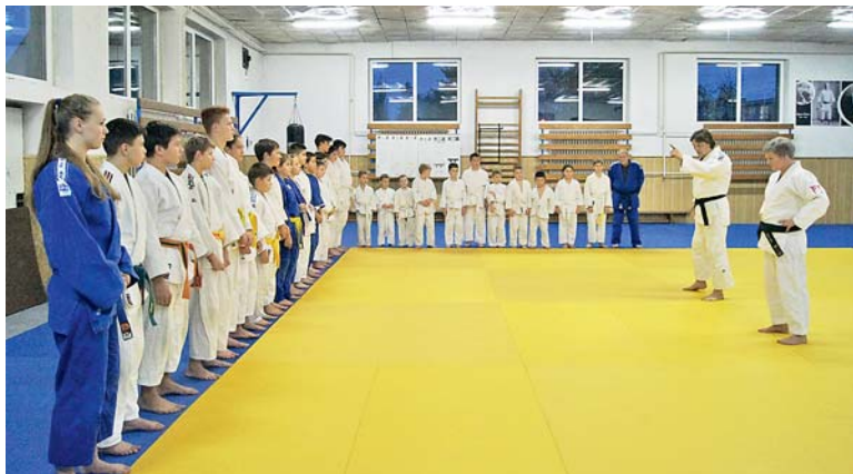
TJ BANÍK KARVINÁ trénuje v judo hale v Havířské ulici

Celý rozhovor naleznete na webu města http://1url.cz/@judo .