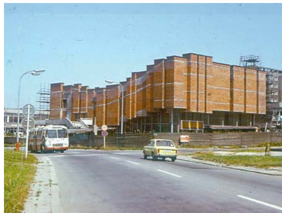
DRUHÝ RETRO DEN 26. 5. proběhne u kina Centrum v Mizerově (foto 70. léta)