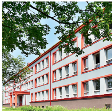
ZŠ CIHELNÍ nová okna a fasáda sluší.

Již v minulém čísle jsme vás informovali o probíhající rekonstrukci zahrady pro předškolní děti v Karviné-Hranicích čp. 2910, kde kromě zcela nových herních prvků dojde také na venkovní terasu pro hry a stravování. Úpravou zahrady včetně instalace nových herních prvků pojde i zahrada u MŠ Centrumáček. Na