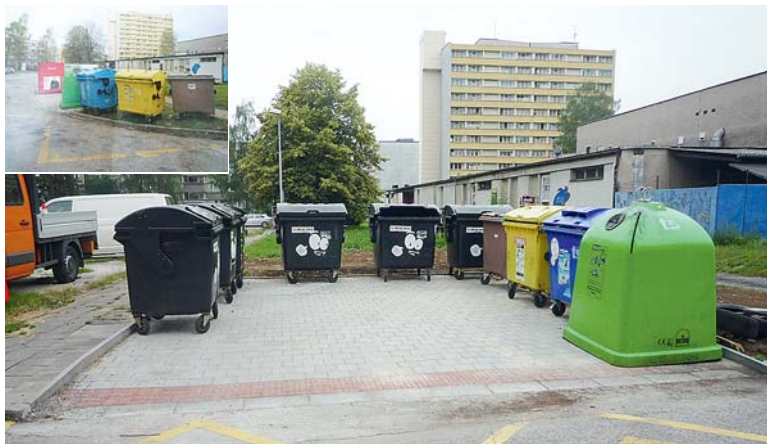
BEZPEČNĚJŠÍ A POHODLNĚJŠÍ MANIPULACI s kontejnery oceňují obyvatelé města i zaměstnanci Technických služeb Karviná.

V průběhu letošního roku Odbor komunálních služeb Magistrátu města Karviné vybudoval dvě nová kontejnerová stání. Investici si vyžádali přímo obyvatelé ulice Dělnické u výměníku a ulice Borovského za tiskárnu. Ať už bylo důvodem stání kontejnerů na veřejné zeleni, nebo jejich nevhodné umístění v zatáčce, požadavky byly projednány a kladně vyřízeny.