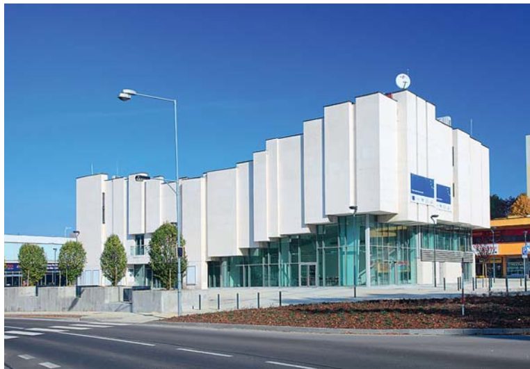
KINO CENTRUM po své rekonstrukci trhá návštěvnické rekordy.

Kromě toho v posledních deseti letech dokázalo vedení města nejen šetřit, ale proinvestovalo neuvěřitelně 2 miliardy korun. „V Karvině to jde vidět. Připomeňme například modernizaci regionální knihovny, letního kina, kina Centrum, Lodiček, Obecního domu Družba nebo výstavbu fotbalového stadionu. Opravily se kilometry chodníků a cest a každý rok se investovalo do budov škol a školek,“ připomněl primátor a dodává: „V současnosti má Karviná v rozpočtu pokryty všechny zásadní investice. Máme 300 milionů korun na krytý bazén, 80 milionů korun na přestavbu Kosmosu, 40 milionů na rekonstrukci ulice Žižkova, 30 milionů korun na opravu prostranství u Permonu, 15 milio-