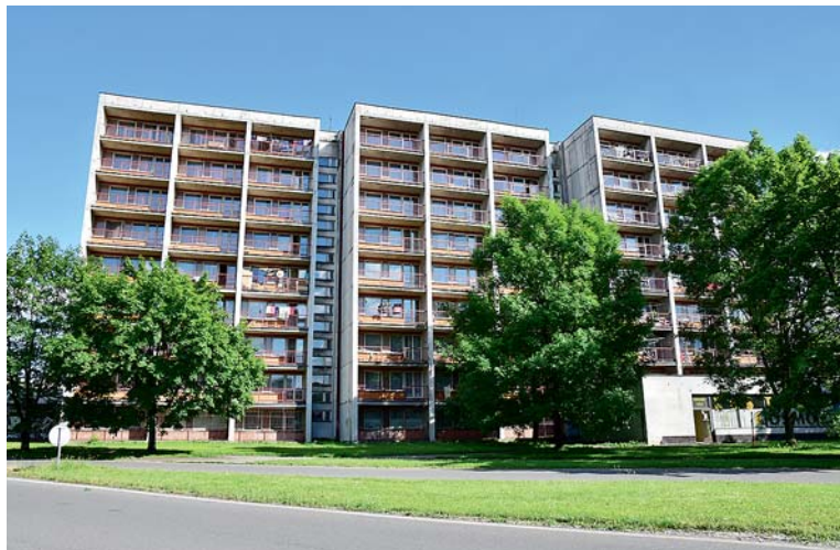
DALŠÍ UBYTOVNA SKONČILA – po zařízení Mašinka u hlavního nádraží skončil na konci srpna i Kosmos, kde budou po rekonstrukci malometrážní byty.

Aby se podařilo všechny body Desatera realizovat, byl zřízen tým „Bezpečná Karviná“ složený ze zástupců bezpečnostních složek, odboru sociálního, zástupců úřadu práce a dalších institucí. „Zásadním krokem, který zajistí větší bezpečnost ve městě a sníží počet problémových lidí, bylo zavedení bezdoplatkových zón a postupné rušení ubytoven. Rozšiřujeme i kamerový systém a od dubna se v ulicích města pohybují strážníci – okrskáři, kteří mají za úkol pomáhat občanům řešit problémy. Osvědčila se i anonymní bezpečnostní linka na webu města a SMS brána, kam své poznatky lidé posílají,“ rozhodl Jan Wolf. Velkým úspěchem bylo i podepsání memoranda s největším vlastníkem bytů na území města. „Město bude mít například možnost kontrolovat, kdo nově se do bytů RESIDOMA stěhuje. Problémoví nájemníci, kterým RESIDOMO neprodlouží smlouvu, budou mít díky zavedeným bezdoplatkovým zónám ztíženou možnost dělat problémy někde jinde na území města,“ vysvětluje úlohu memoranda primátor. V rámci Desatera byla také zavedena nová městská vyhláška o regulaci provozování hazardních her na území statutárního