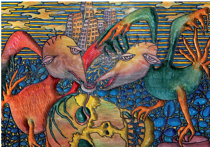
„Boj o život“ | kolorovaná dřevorezba | 64 x 42 cm | 2019