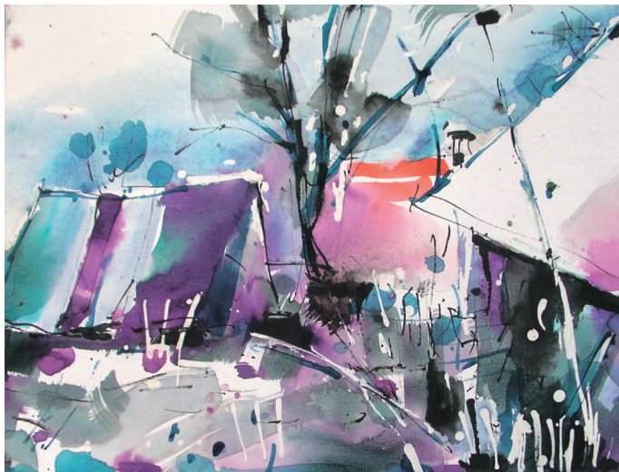
„Bukovec 2“ | akvarel | 30 x 40 cm | 2019