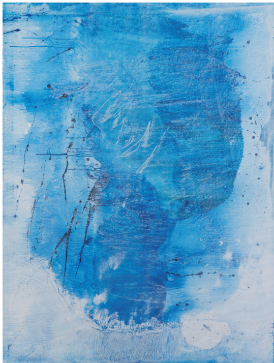
z cyklu „Překrývání I“ | akryl | 150 x 100 cm | 2018