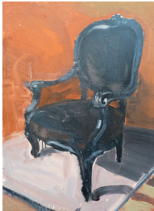
„Autoportrét II“ | 75 x 55 cm | olej na plátně | 2018

Kontakt: +420 721 289 853 | maria@boszczyk.cz | Bydliště: Český Těšín |