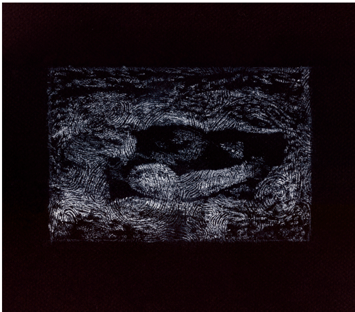
„Hle – člověku!“ | suchý pastel | 32 x 25 cm | samotná kresba 15 x 10 cm | 2019