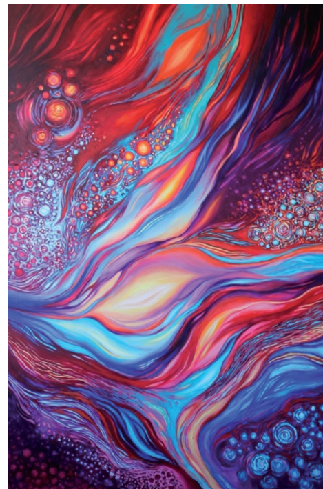
Emanacja Bogini III lub Kosmiczna wagina | 100 x 150 cm | olej na plátně | 2016