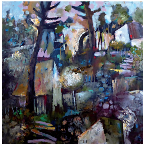
Na vsi | olej | 80 x 80 cm | 2019