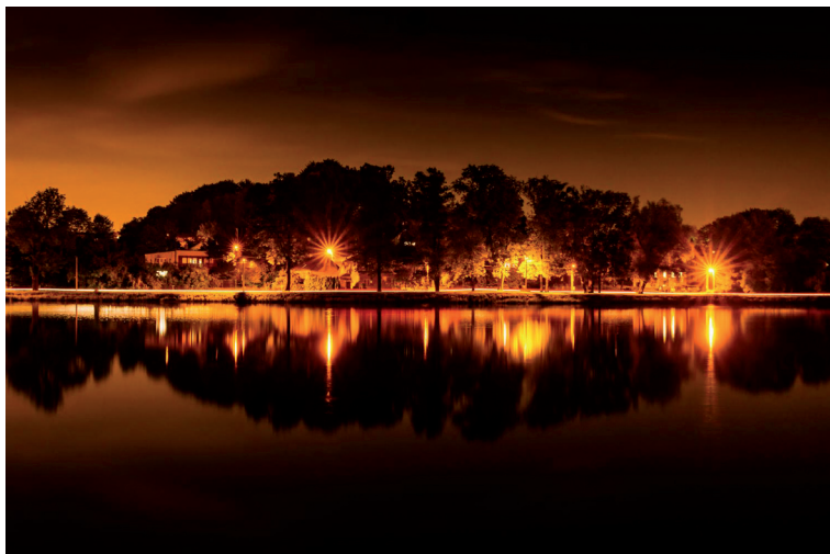
Petrovická promenáda | fotografiena plátně | 90 x 60 cm | 2018