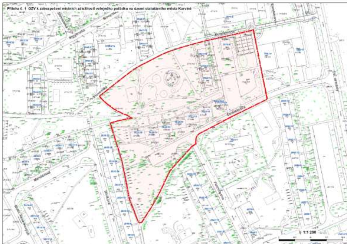
Zóna ul. Einsteinova

Přehled veřejných prostranství, na kterých jsou zakázány činnosti, které by mohly narušit veřejný pořádek