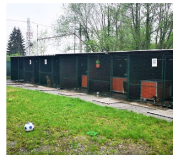
V psím útulku v Karviné-Darkově je automaticky čipován každý pesek

Zákonná povinnost čipování je spojena s povinným očkováním proti vzteklině. Čipování by se neměl žádný majitel vyhnout. Hrozí mu totiž několikatisícová pokuta až do výše 20 tisíc korun. Identifikační známka pod kůží má prioritně zamezit chovům psů v nelegálních množnách a díky ní se také snadněji dohledá majitel psa při případném zatoulání. Do současné doby je v Karviné zaevidováno 4500 očipovaných psů. Ročně v Karviné veterináři načipovali zhruba kolem tří stovek psů,