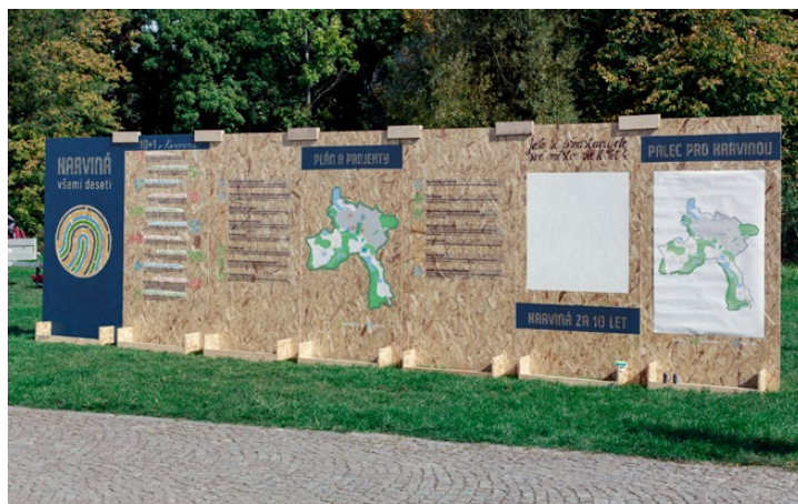
Poutavou prezentací projektu nelze na akcích přehlédnout