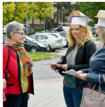
Knihpatrolky v ulicích

vily knihovnice pobočky Karviná-Mizerov. Na ulici v krásných knihovnických kostýmech oslovily přes 250 kole-