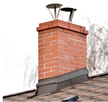
Provozování kotlů na tuhá paliva 1. a 2. emisní třídy, splňující výše uvedené podmínky, bude od září 2022 zakázáno!

Musíme se také připravit na zásadní zprůsvětlení provozování zdrojů na pevná paliva o jmenovitém tepelném příkonu do 300 kW včetně, které slouží jako zdroj tepla pro teplovodní soustavu ústředního vytápění a které nejsou navrženy rovněž pro přímé vytápění místa instalace. Jedná se tedy například o kotle umístěné v kotelně, nikoliv o krby, kamna instalovaná přímo v obytné části stavby.