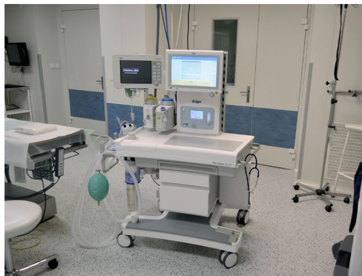
Anesteziologický přístroj Perseus

Větší část nových přístrojů je na svých odděleních v Karviné, ale