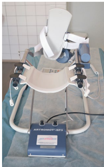
Kotníková motodlaha Artromot SP3

Nemocnice s poliklinikou Karviná-Ráj finišuje v modernizaci přístrojového vybavení, které je spolufinancováno Evropskou unií. Projekt s názvem Modernizace vybavení pro obory návazné péče v NsP Karviná-Ráj, p. o., získá částku 76 610 000 korun. Spoluúčast financování ze strany Evropské unie a státního rozpočtu pokryje 90 % způsobilých realizovaných výdajů, zbývajících 10 % hradí nemocnice z vlastního rozpočtu.