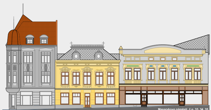
Vizualizace projektu rekonstrukce tří domů na Masarykově náměstí