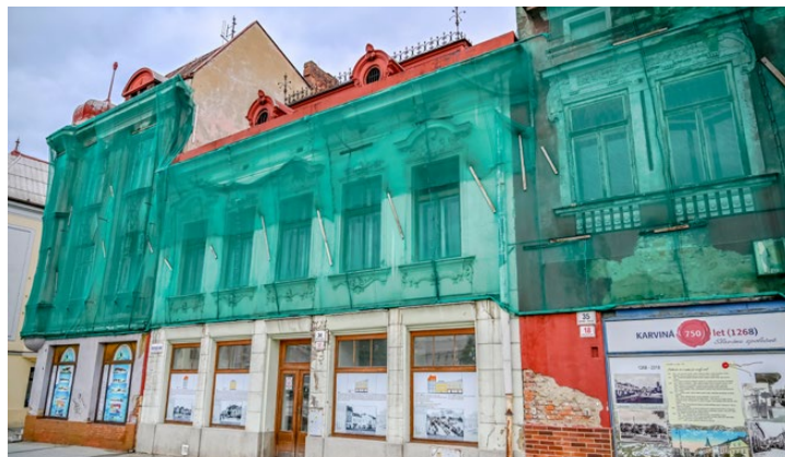
Nynější podoba objektů před zahájením rekonstrukce