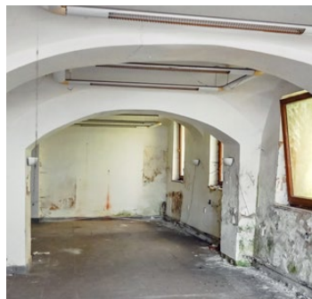
Interiéry domů v současné podobě

Na rekonstrukci domů poskytl dotaci ve výši padesáti milionů korun Moravskoslezský kraj. „Věděli jsme, že cena rekonstrukce bude docela vysoká, proto