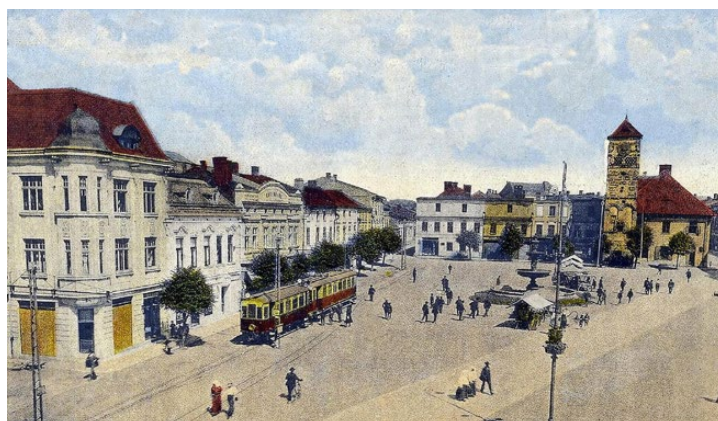
Masarykovo náměstí se třemi domy v plné kondici na pohlednici z roku 1930