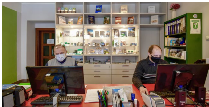
Městské informační centrum patří k Masarykovu náměstí ve Fryštátě

Je už samozřejmostí, že v každém městě najdete Městské informační centrum, někdy nazývané také jako Infocentrum nebo Ičko. Nechybí také v Karviné, sídlí přímo v historické části na Masarykově náměstí ve Fryštátě. Je oficiálním městským a turistickým informačním centrem, jehož základním posláním je informační činnost a propagace města Karviné v rámci České republiky i v zahraničí.