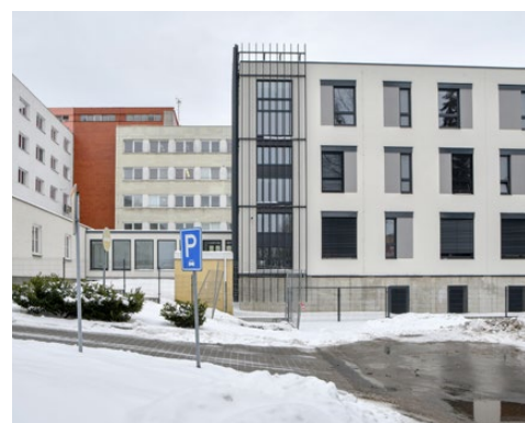
▼ INZERCE ▼