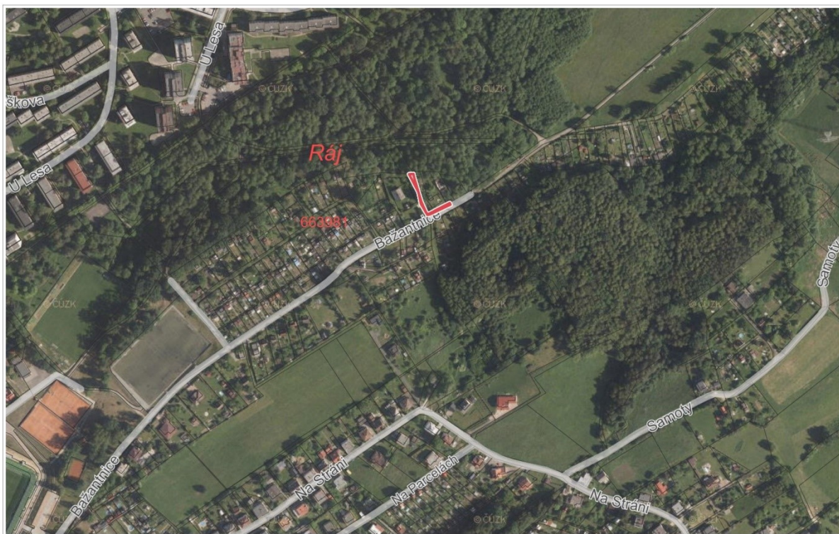
Ortofoto: © ČÚZK, Katastr: © ČÚZK, RÚIAN: © ČÚZK