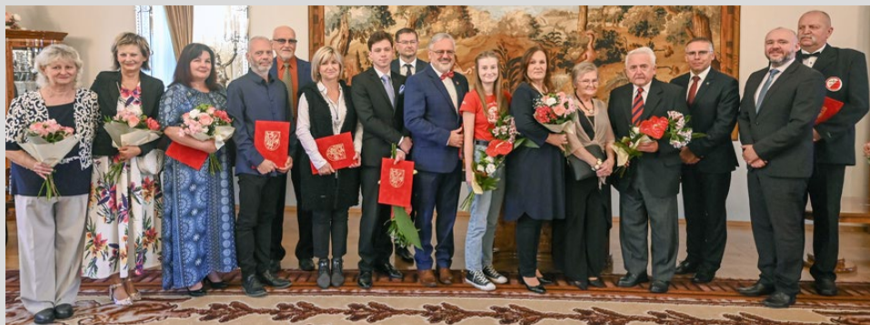
Oceněné osobnosti v oblasti kultury