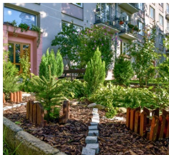
ulice Urxova 1544