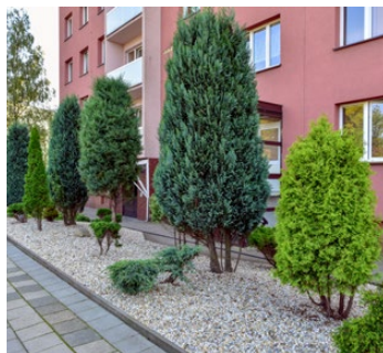
ulice U Lesa 802–803

Do rozsáhlého zvelebení se pustili také obyvatelé domu na ulici U Lesa. „I přes nepříznivý rok 2020 ztížený covidem jsme se jako bytové družstvo pustili do zvelebení. Zkrášlili jsme předzahrádky v okolí domu, konkrétně jsme vysadili 64 tújí a okrasnou zeleň, na zem jsme rozprostřeli kačirek a štípaný kámen. Vše dohromady vytvořilo kouzlo zahrady, která potěší každé oko. K tomu jsme vytvořili devět parkovacích míst a položili jsme novou dlažbu chodníku včetně drenáže na odvodnění,“ uvedl Karel Sebera.