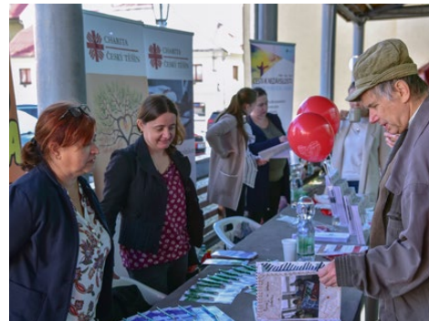
MiniVeletrh prezentovaných služeb