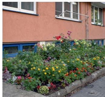
ulice Slovenská 2943–2945