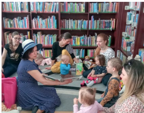
Bookstart – S knížkou do života