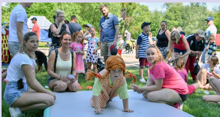
Krásné počasí, vysmáté děti, atrakce, stánky, aktivity, příjemní animátoři s moderátorkou a výborná kuchyně, přesně tak vypadala pohádková městská akce Den pro celou rodinu.