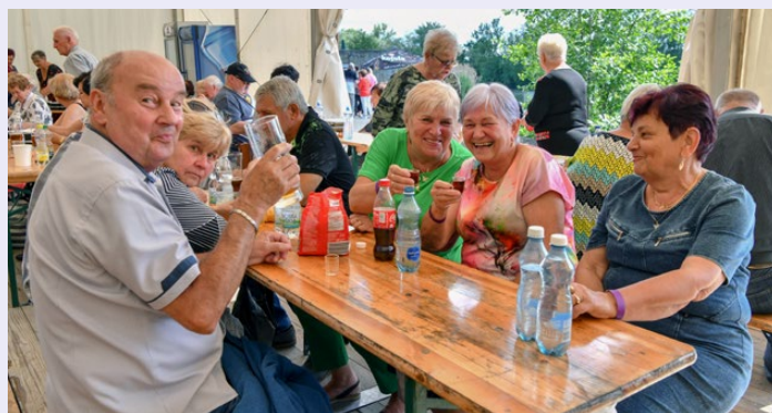
Karvinští senioři si na Lodičkách užili Letní slavnost, přátelské setkání a taneční zábavu pro ně připravil Odbor sociální Magistrátu města Karviné.