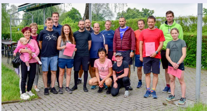
Parta sportovců se potkala na tradičním triatlonu Táni Červené Rudou stezkou okolo hřbitova a zpět 2022. Závodníci i přes deštivé počasí zvládli 750 m plavání, 20 km jízdy na kole a 5 km běhu.