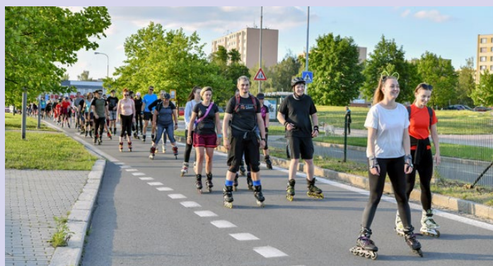
Mládežníci rady Karviné společně s veřejností si užili tradiční jízdu na kolečkových bruslích bez aut po hlavních tazích města. Akci Na inline po Karviné přálo počasí.