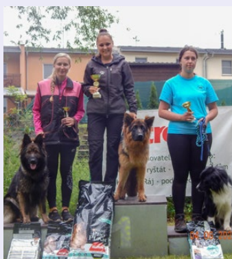
Na kynologickém cvičišti ZKO-016 Karviná-Hranice proběhl závod ve sportovní kynologii, kterého se účastnilo devatenáct dvojic. Bojovali v disciplíně poslušnost a někteří v obraně.