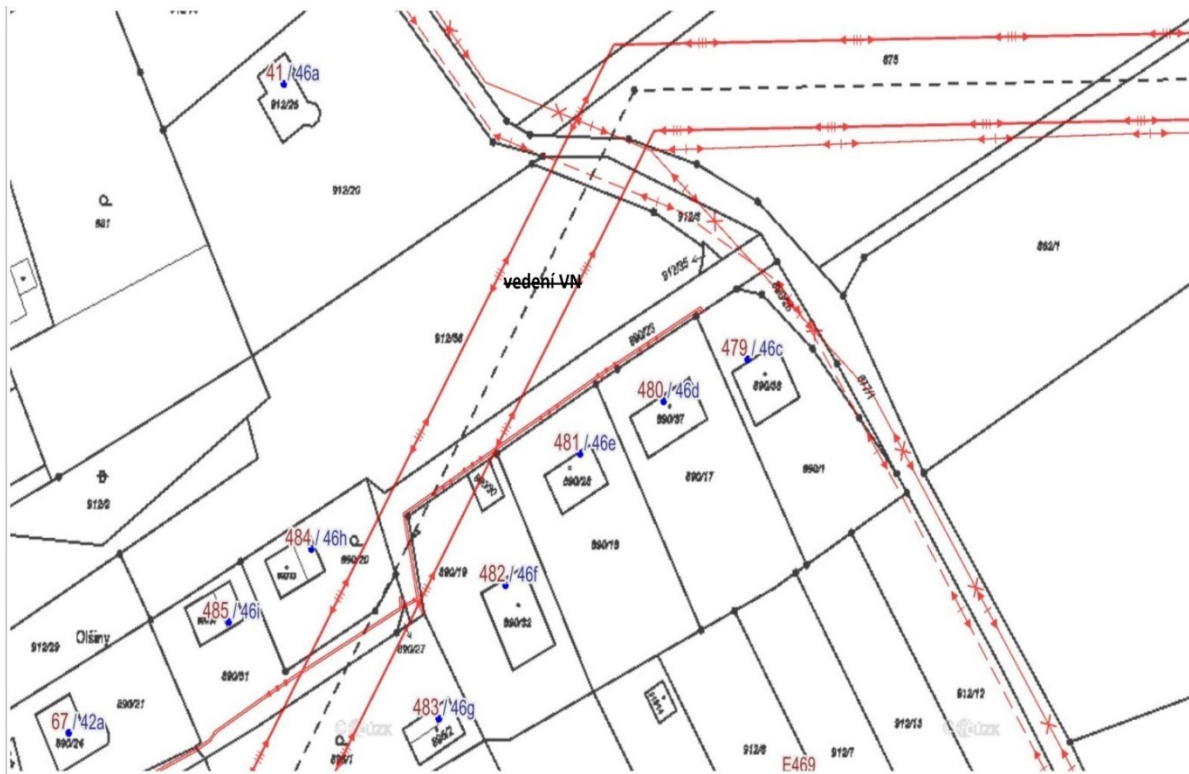
Vlastnická mapa – růžové vyznačení vlastníků SMK