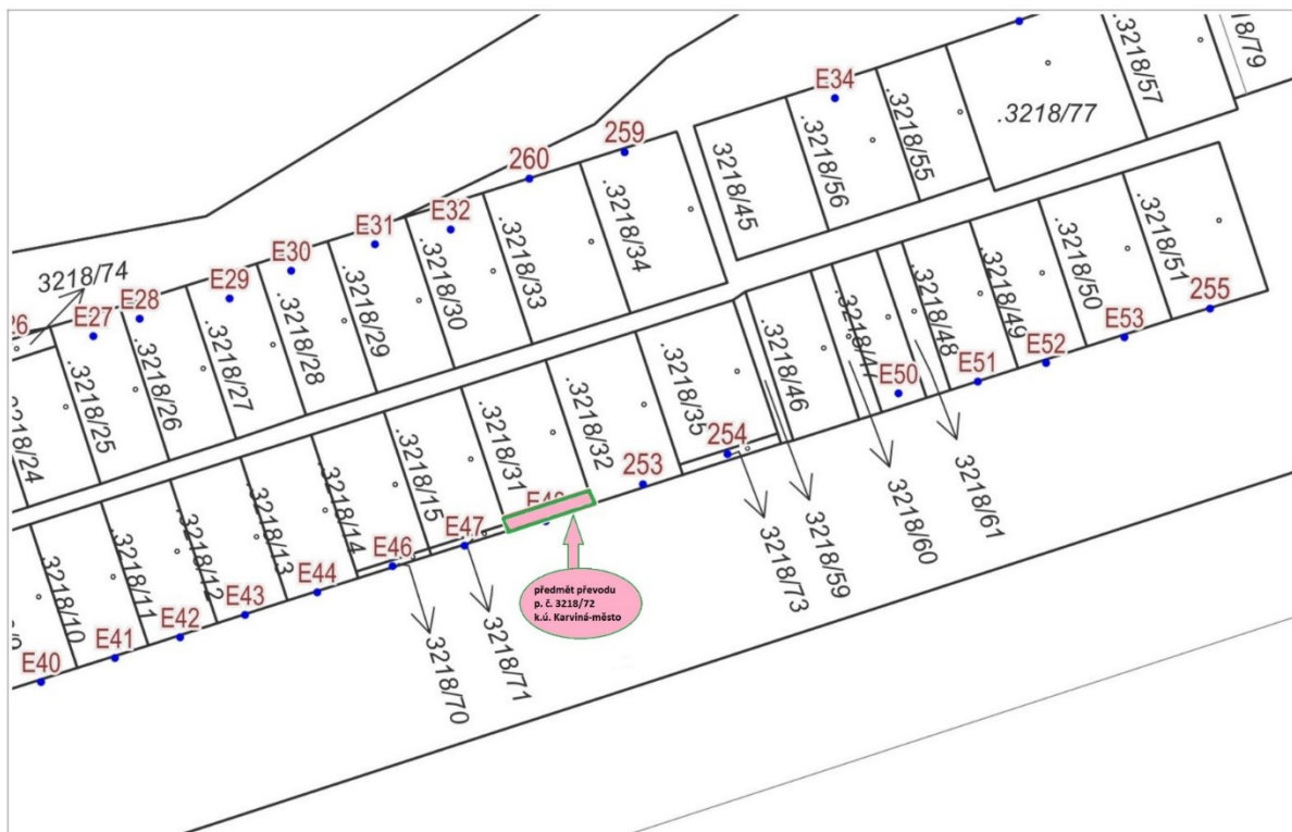
Katastr: © ČÚZK, RÚIAN: © ČÚZK