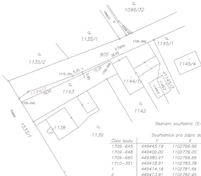
Seznam souřadnic (S-JTSK)