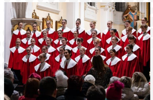
Vánoční koncert Permoníku ve farním kostele