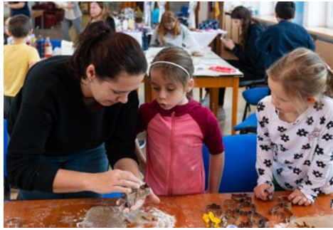
Perníková pekárna v SVČ Juventus, Karviná