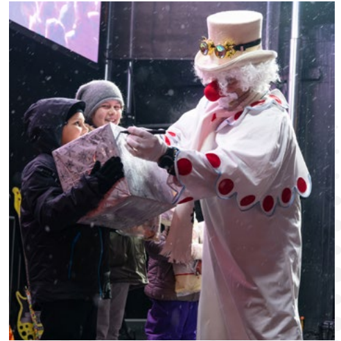
Mikulášská nadílka na náměstí s Albertíkem