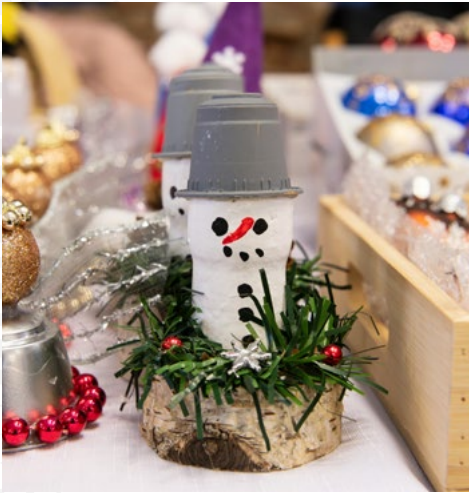
Cesta k vánoční harmonii v MěDK Karviná