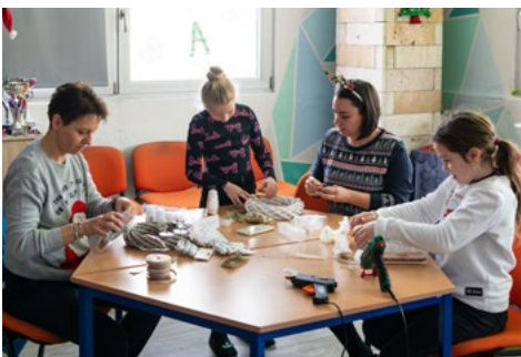
Vánoční tvoření s MÚZOU v Karviné-Fryštátě