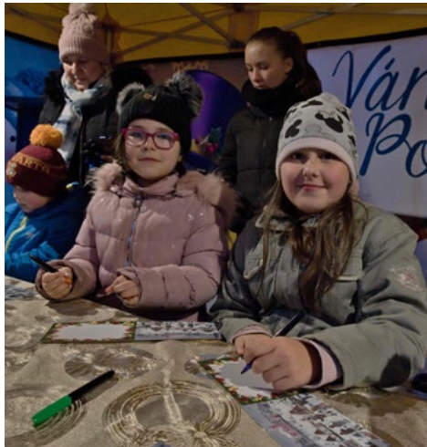
Pošta pro Ježíška na Vánočním jarmarku