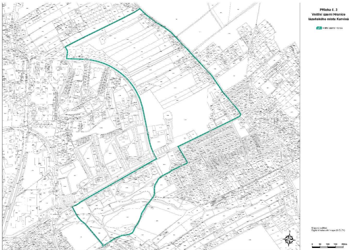
Obrázek - grafické vyznačení vnitřního území Hranice na podkladu katastrální mapy