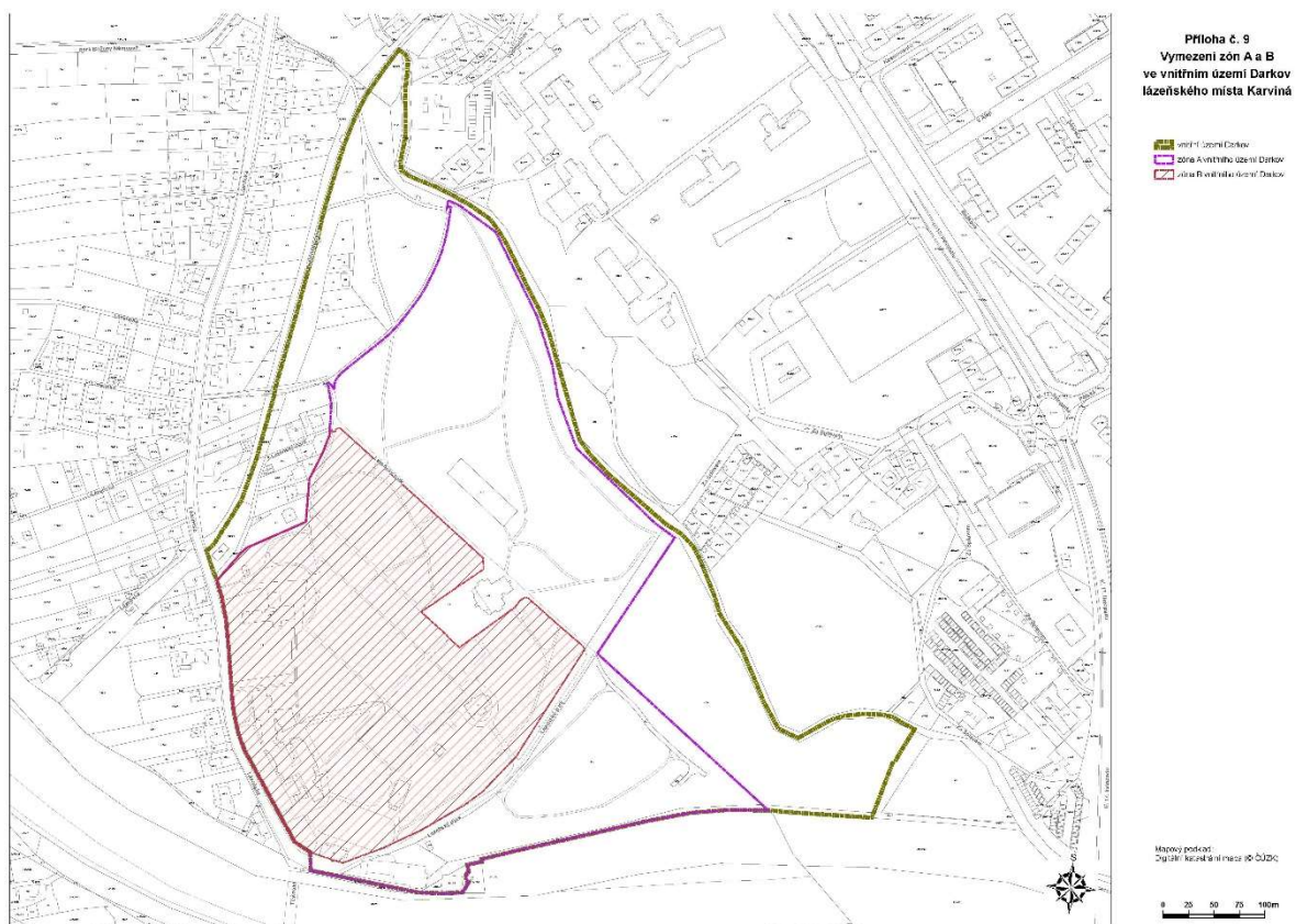
Obrázek - grafické vyznačení zón A a B ve vnitřním území Darkov na podkladu katastrální mapy