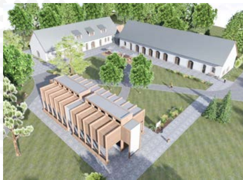
Vizualizace rekonstrukce koníren