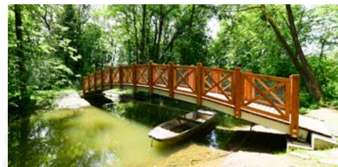
Revitalizace vodní plochy v parku

„Máme za sebou potřebnou revitalizaci vodní plochy v parku Boženy Němcové, která probíhala od roku 2022. Došlo k odbahnění, úpravám břehů a výstavbě šterkové stezky pro pěší, nová dřevěná lávka spojuje jeden z ostrůvků s břehem, na odpočinkových místech se objevily k sezení nové moderní lavičky vyrobené z kmenů stromů, nechybí ani výsadba stromů a nových keřů. Víím, že akce v areálu Lodiček se těší velké oblibě. Za dobu třinácti let provozování stoupla významně návštěvnost a vidím potřebu úpravy této části parku v budoucnu, ať to je vznik stinných míst nebo dovybavení dalšími objekty a plochami pro sportovní nebo kulturně společenské akce. Věřím, že realizace nového uspořádání Lodiček zvýší komfort návštěvníkům, kteří zde rádi tráví volný čas.“