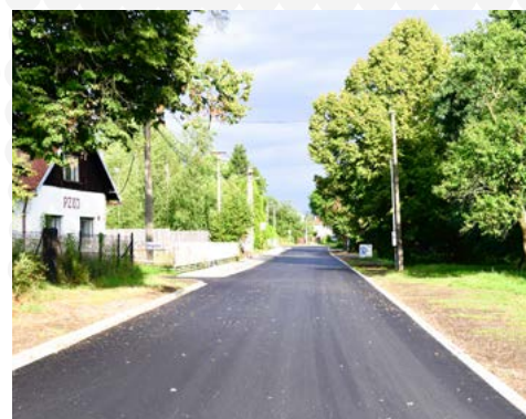
Rekonstrukce komunikace ve Starém Městě

„V průběhu letních prázdnin jsme nepolevili ani v potřebných opravách místních komunikací a pokračujeme dál. Opravili jsme vozovku na poslední části místní komunikace ulice Školská po křižovatce s ulicí V Aleji a k tomu i přilehlý chodník a prostor před garážemi. Zaměřili jsme se na místní komunikace na nám. O Foltýna. V následujících měsících projde opravou komunikace na ulici Olbrachtova, která navazuje na nově vybudovaný kruhový objezd nedávno zrekonstruované ulice Borovského. V říjnu letošního roku plánujeme položení nového asfaltového povrchu na části místní komunikace ulice Včelařská, kde ještě před tím společnost ČEZ vymění nadzemní vedení nízkého napětí. K položení nové zámkové dlažby dojde na chodníku spojující ulice Ve Svahu a U Lesa. V Karviné odhadujeme celkovou délku chodníků přes 83 tisíc metrů, místní komunikace s parkovišti měří přes 115 tisíc metrů a účelové veřejně přístupné komunikace mají délku přes 51 tisíc metrů. To představuje opravdu značný rozsah. Není možné opravit všechno naráz, a proto pečlivě plánujeme, které úseky potřebují největší pozornost, vycházíme také z podnětů občanů, snahou je toho opravit a modernizovat co nejvíce, jde však o nikdy nekončící proces.“