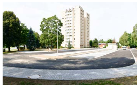
Úprava veřejného prostranství mezi bloky

„Blížíme se do finále posledními úpravami prostoru mezi tř. 17. listopadu a ulicí Nedbalovou. Kapacitu parkování jsme navýšili na 79 parkovacích míst a pět vyhrazených stání pro zdravotně postižené osoby. Součástí úprav je dětské hřiště s lavičkami, výsadba nových stromů a ozelenění kolem. Věřím, že dojde ke zklidnění dopravy, zvýšení bezpečnosti účastníků silničního provozu a k zajištění bezpečného pohybu chodců mimo dopravní prostor.“