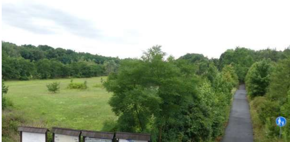
Pohled z kostela sv. Petra z Alcantary k JZ přes louky v upravené nivě Karvinského potoka k prostoru SV části plochy dílčí změny ZM5.07 (porost na levém horizontu). Foto M. Macháček (07/2023)

Magistrát města Karviné, Odbor stavební a životního prostředí Fryštátská 72/1, 733 24 Karviná – Fryštát