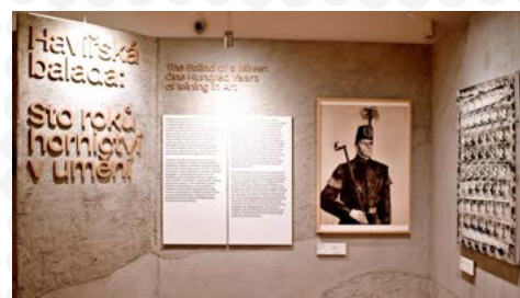
Dny evropského dědictví si i přes nepřízeň počasí nenechala ujít celá řada milovníků historie. Lákadlem byla i nová výstavní expozice.