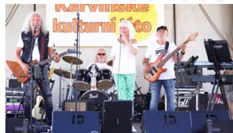
Městský dům kultury Karviná si na Karvinském kulturním létě dává záležet. Ne jinak tomu bylo i letos, a každý si tak našel to své.