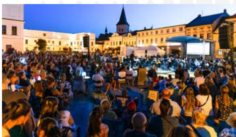
Májovák umí i filmové hity, o tom se zaplněné náměstí ve Fryštátě přesvědčilo i letos.