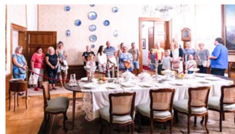
Fryštát má své kouzlo i v době, kdy se prodlužují stíny – navštívili jste Zámeckou noc?