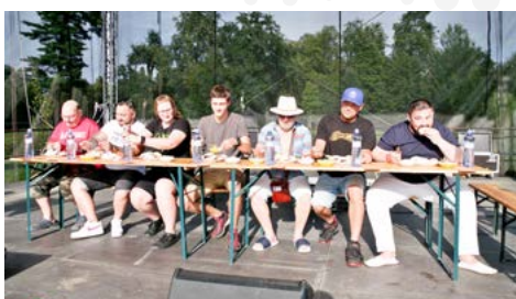
Oblíbené Slavnosti piva a guláše nabídly vedle ochutnávek soutěžních gulášů i soutěže v pojídání knedlíků či v točení piva.