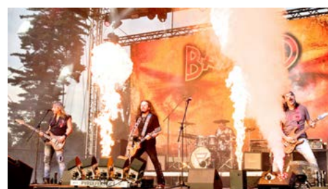
Na akci Karviná Rocks 2024 potěšila fanoušky rockové hudby i kapela Bastard.