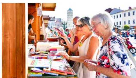
Knižní jarmark 2024 měl co nabídnout.