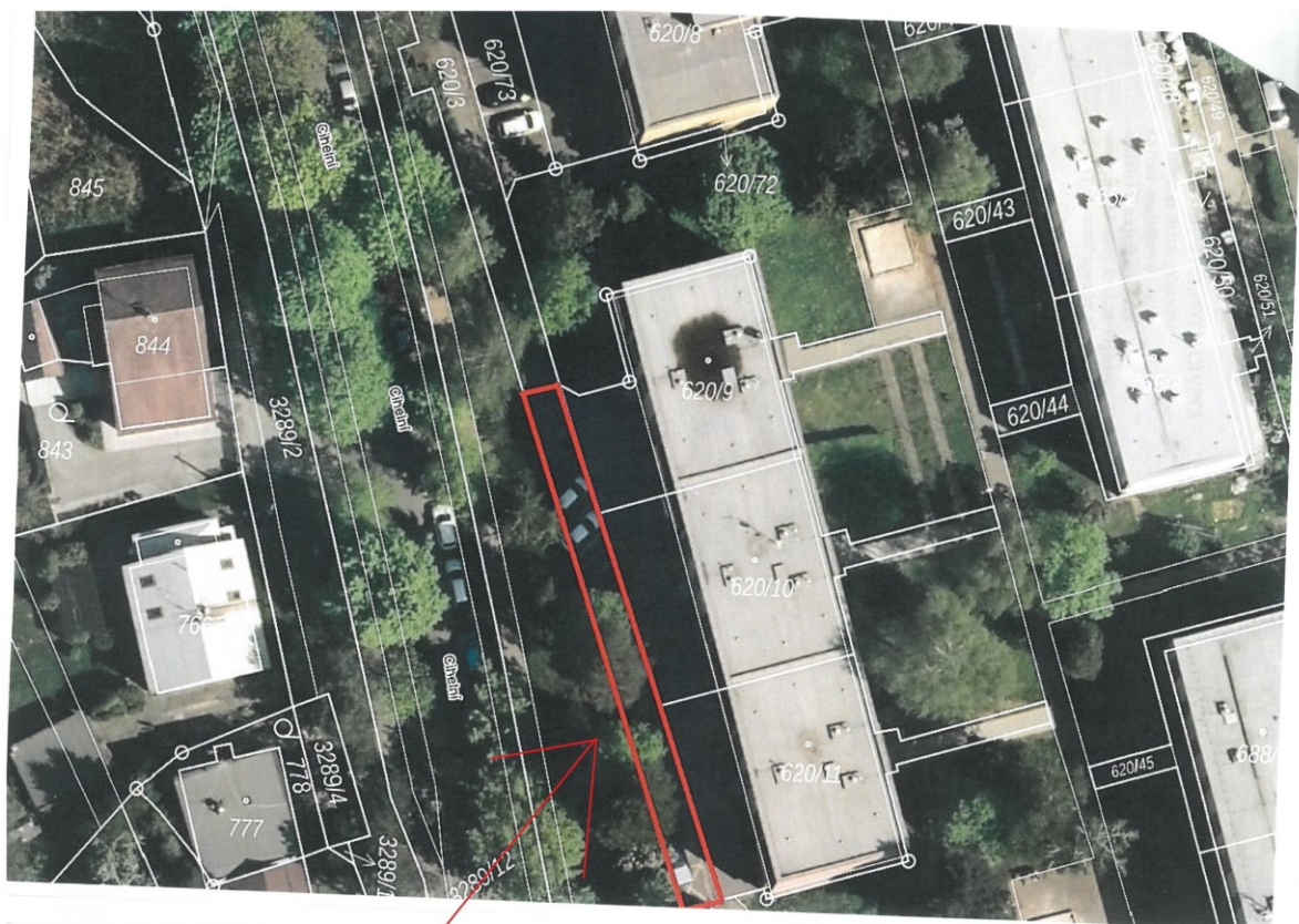
část pozemku p. č. 620/3 v k.ú. Karviná-město